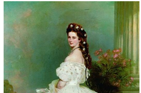
Abbildung 2: Elisabeth von Habsburg

_____ sich an ihre neue Rolle als Kaiserin zu gewöhnen, da sie noch sehr jung und wenig vorbereitet auf die Verantwortung, die einer Kaiserin zukommt, war.