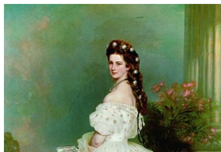
Abbildung 2: Elisabeth von Habsburg

Anders als ihr Mann hatte Sisi große Schwierigkeiten sich an ihre neue Rolle als Kaiserin zu gewöhnen, da sie noch sehr jung und wenig vorbereitet auf die Verantwortung, die einer Kaiserin zukommt, war.