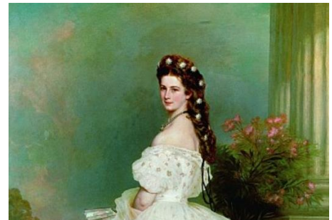
Abbildung 2: Elisabeth von Habsburg

Anders als ihr Mann hatte Sisi große Schwierigkeiten sich an ihre neue Rolle als Kaiserin zu gewöhnen, da sie noch sehr jung und wenig vorbereitet auf die Verantwortung, die einer Kaiserin zukommt, war.